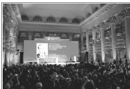
ЛАУРЕАТЫ ПРЕМИИ «ЮРИСТ ГОДА – 2025» Стр. 14