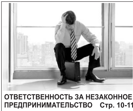
ОТВЕТСТВЕННОСТЬ ЗА НЕЗАКОННОЕ ПРЕДПРИНИМАТЕЛЬСТВО Стр. 10-11