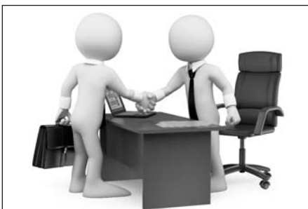
ДОГОВОР МЕНЫ: НЮАНСЫ СДЕЛКИ Стр. 10-11