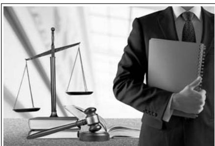
ОТСТРАНЕНИЕ АРБИТРАЖНОГО УПРАВЛЯЮЩЕГО Стр. 6-7