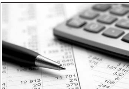
«ПРИБЫЛЬНЫЕ» ВОПРОСЫ Стр. 12-13