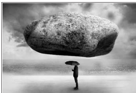
ФОРС-МАЖОР: ПРОБЛЕМЫ ТОЛКОВАНИЯ