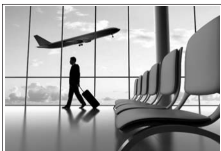
ПОД КРЫЛОМ САМОЛЕТА